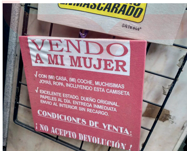
Camiseta de tienda en Sevilla. 29 de diciembre de 2017.

Desde ese momento hasta nuestros días las mujeres han conseguido un gran avance en materia de derechos a nivel formal. Aun así, todavía se encuentran muchas señales que apuntan a creencias como la de que “los esposos deben gobernar a sus mujeres” o que “las mujeres son una pertenencia de sus maridos”. Son creencias limitantes que sitúan a los hombres en situación de superioridad, justificándose los ejercicios de poder de ellos sobre ellas. Se justifican a través del humor, de la tradición, de la “normalidad” y desde la idea del “orden natural de las cosas”. En todas partes se pueden identificar muestras de cómo la sociedad concibe a “la mujer”.