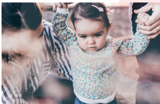
Reflejo de la marcha