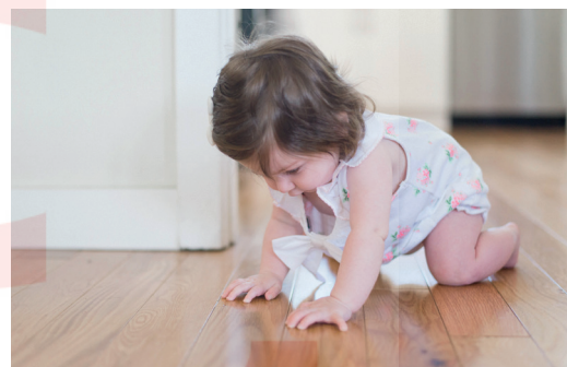
Reflejo del gateo

Durante los primeros meses, la tonicidad muscular es bastante pobre, apenas levanta la cabeza, se inicia en el descubrimiento de las manos y juega con ellas. Poco a poco comienza a agitar y flexionar los brazos y piernas de manera constante.