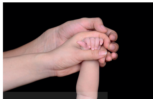
Reflejo de prensión