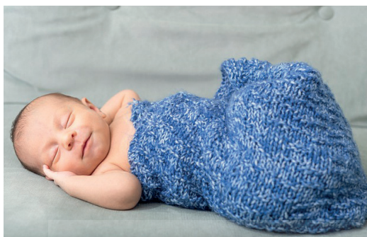
Reflejo tónico del cuello